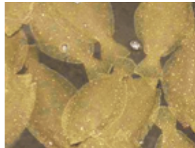
世界初となる耐病性ヒラメ系統の作出

今後は、耐病性責任遺伝子の探究から、野生集団の遺伝的多様性保全のための研究に展開したいと考えています。