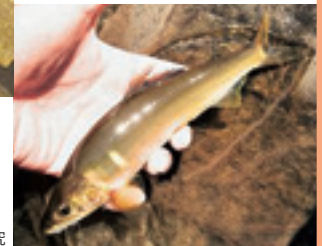
野生アユを用いた耐病性ゲノム研究