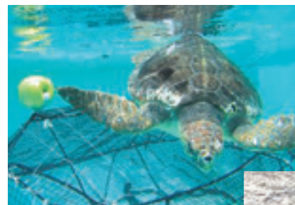
ウミガメ脱出支援システム

また、定置網漁業では、網に迷い込んで溺死してしまうウミガメを網の外へ逃がす手法（ウミガメ脱出支援システム）の開発を行うなど、絶滅危惧種の生物を守るために様々な混獲問題に取り組んでいます。