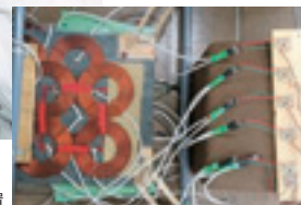
ワイヤレス給電装置