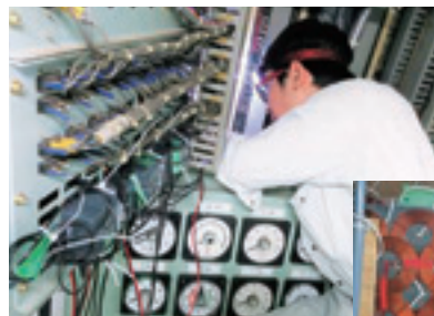
練習船の運航データの計測作業

本研究室では、本学の大型練習船を含む各種の船舶運航データの実測および解析を行うことで、より良い船内電機システムを検討しています。また、水中探査機向けのワイヤレス給電装置の開発にも取り組んでいます。