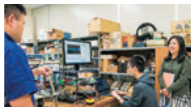
回転型倒立振り子実験装置

この技術を探求しているのが「制御工学」です。我々とともに、より良い制御手法を研究しませんか？