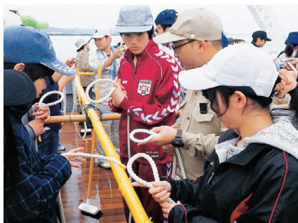
フレッシュマンセミナー