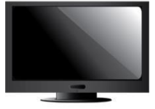
【越中島キャンパス】

◆ メールアドレスを登録すると、講義日程・内容等をメールでお知らせします。ホームページから登録できます。 http://www.kaiyodaicareer.com/