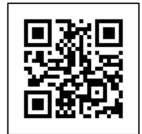
【校友会ホームページ QR コード】

海洋大の「今」が分かるコンテンツを少しずつ充実させています。ぜひ、実際に使ってみてください。