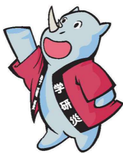
学研災キャラクター サイチャン