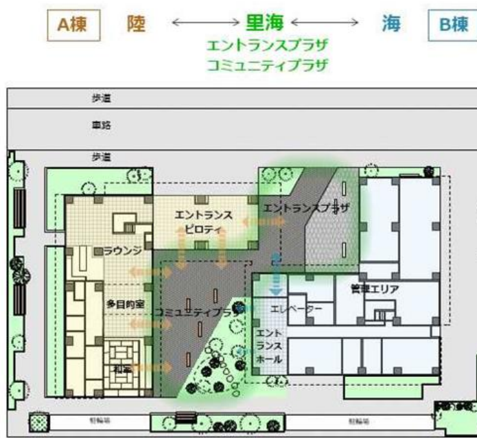
交流スペースの配置計画

日本人、外国人問わず多様な学生・研究者との共同生活を通じた異文化の中でも発揮できるリーダーシップ等の涵養を図る観点から、共用部分に入居者交流ラウンジや多目的室、また共用キッチン等を備えた入居者同士の自然な交流を促すことを目的としたスペースを多数設けています。