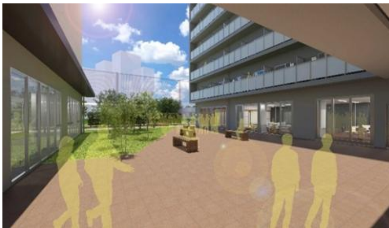
コミュニティプラザ