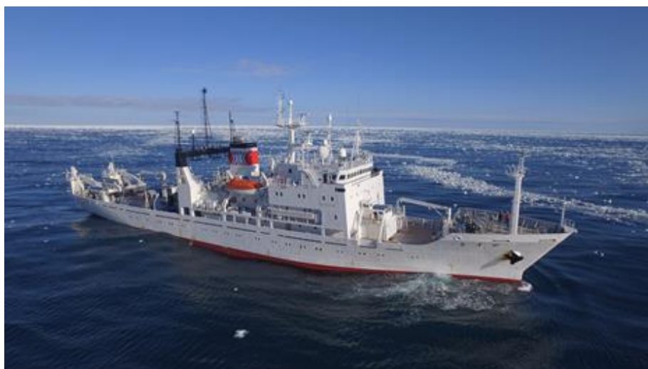
2018-19年に南極海の観測を行った開洋丸

本研究成果は，2020年9月15日（火）公開の Scientific Reports 誌に掲載される予定です。