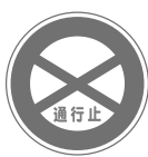
通行止め Road closed