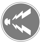
警笛鳴らせ Sound horn