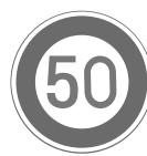
最高速度 Speed limit 50 km/h