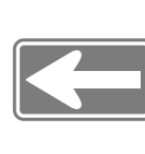
一方通行 One way only