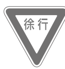
徐行 Reduce speed