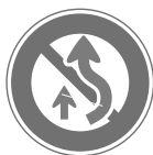
追越し禁止 No overtaking

The main traffic signs and public signs that you will see as you go about your daily life are shown below.