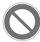
車両通行止め Closed to all vehicles