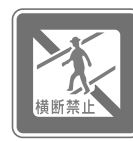
歩行者横断禁止 Crossing by pedestrians prohibited