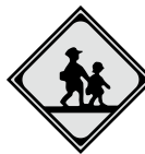
学校、幼稚園、 保育所などあり School zone