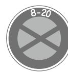
駐停車禁止 No parking or stopping