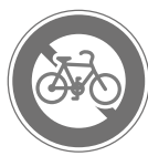
自転車通行止め No bicycles