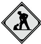
道路工事 Under construction