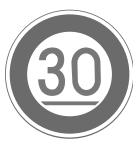
最低速度 Minimum speed 30 km/h