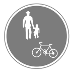
自転車および歩行者専用 Bicycles and pedestrians only