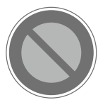
駐車禁止 No parking