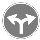
指定方向外進行禁止 Proceed only to designated directions