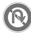
転回禁止 No U-turn