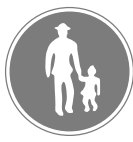
歩行者専用 Pedestrians only