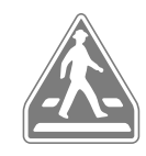
横断歩道 Pedestrians crossing