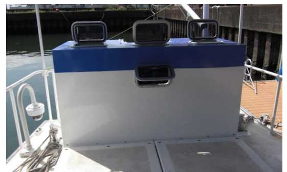
燃料電池を搭載した「らいちょう N」