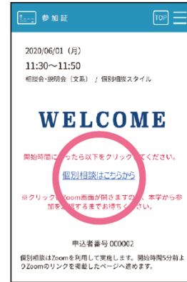
スワイプ後の画面