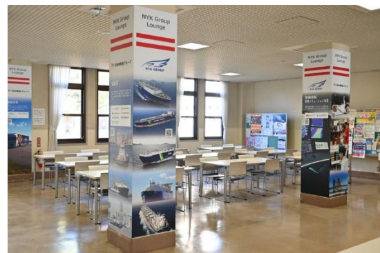
NYK Group Lounge